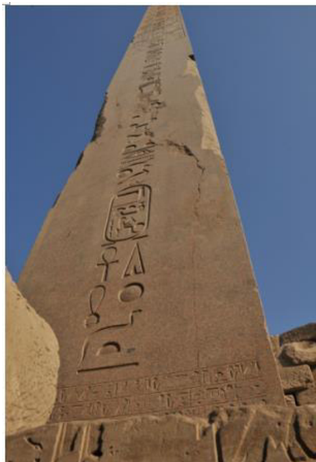
Карнак, Храмът на Амун, Обелиск на Хатшепсут /фиг.1/

Основните извори, които свидетелстват за управлението на Хетшапсут са йероглифите по стените на храма в Дейр ел Бахри. Храмът е не само изключително постижение на архитектурата, но и ценен исторически извор. По неговите стени в картини и текстове царицата разказва за своето рождение, за живота си, за строителната дейност и за вярванията на древните египтяни. В храма на Амун в Карнак, Хатшепсут издига четири гранитни обелиска. На единия от тях / фиг.1 / е изписано безпокойството на фараонката за стойността на живота и труда ѝ. Друг, също толкова ценен извор са надписите на Инени, главният архитект по времето на Тутмос I и II.